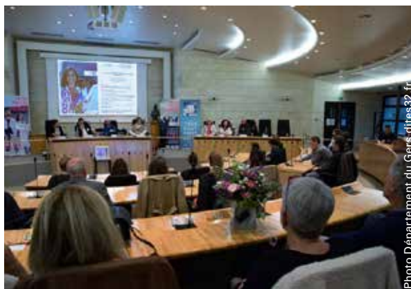
Soirée d'accueil des internes en médecine en stage dans le Gers