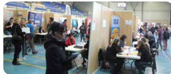
Au forum du recrutement le 21 mars