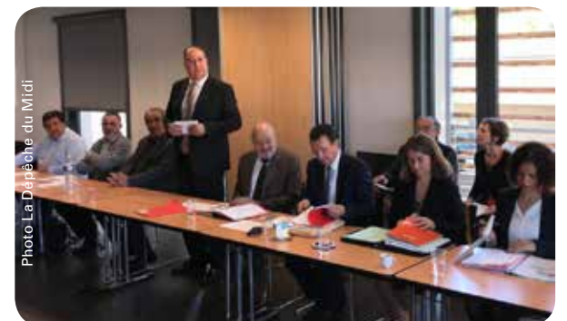
Territoire d'Industrie : avec le Pays Portes de Gascogne et le Pays Garonne Quercy Gascogne pour soutenir les industries locales