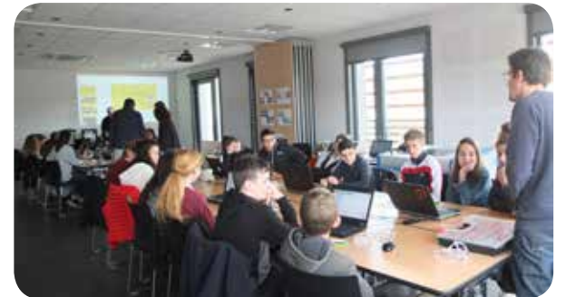
Les groupes d'élèves se sont succédés au Fablab éphémère