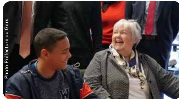
Visite de Madame la Ministre de la cohésion des territoires au fablab éphémère et rencontre avec les élèves de 2nde du Maréchal Lannes