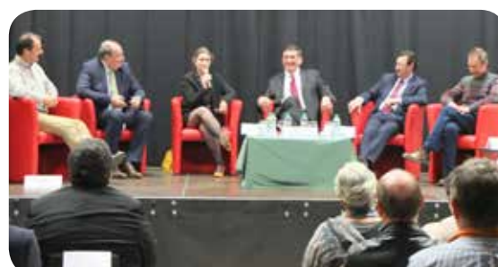
Soirée économique POLE 21 : table ronde sur le thème de l'innovation avec le Président d'Airbus Développement et Madame la Sous-préfète.