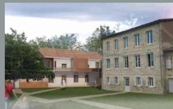
Le pôle de santé sera aménagé sur le site Gambetta à Lectoure

Cette opération permettra de doter l'engagement des professionnels de santé du Lectourois d'un outil immobilier adapté à la pratique mutualisée et pluridisciplinaire de la santé, et concourir ainsi à l'attractivité du territoire pour attirer de nouveaux professionnels.