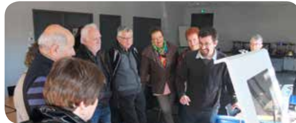
Lors de l'atelier fablab avec les Seniors