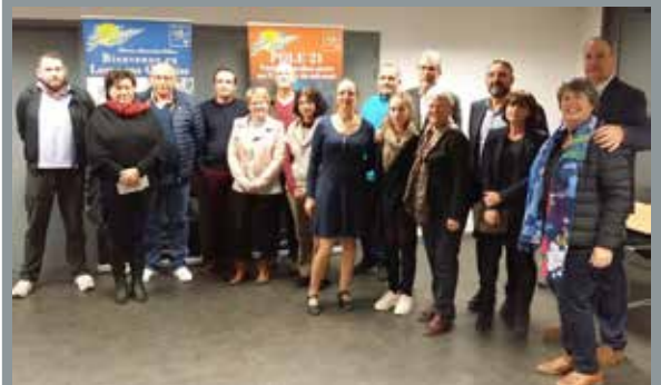
Lors de la dernière cérémonie de remise des subventions du FISAC