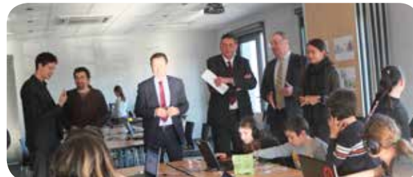
Visite du Président d'Airbus Développement au fablab éphémère