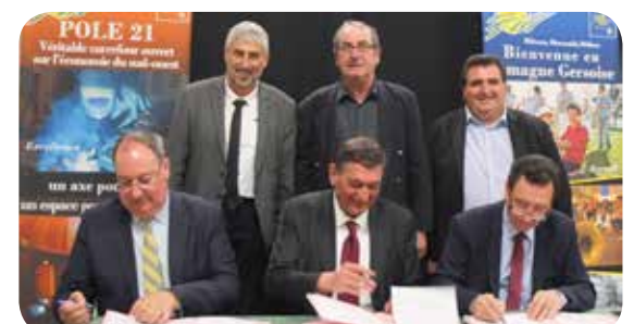
Convention de partenariat pour l'innovation signée avec Michel Sesques, président d'Airbus Développement, lors de la soirée POLE 21