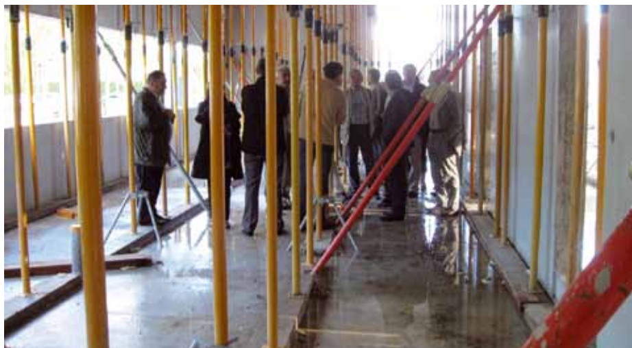
▲ Visite du chantier, le 26.09.2012

La communauté de communes construit un établissement sur le site de Fleurance de l'Établissement Public de Santé de Lomagne (EPSL), destiné à accueillir une vingtaine de médecins et spécialistes paramédicaux. La création de la maison de santé doit permettre de favoriser, à terme, l'installation de nouveaux professionnels dans notre territoire. Son ouverture est prévue en 2013.