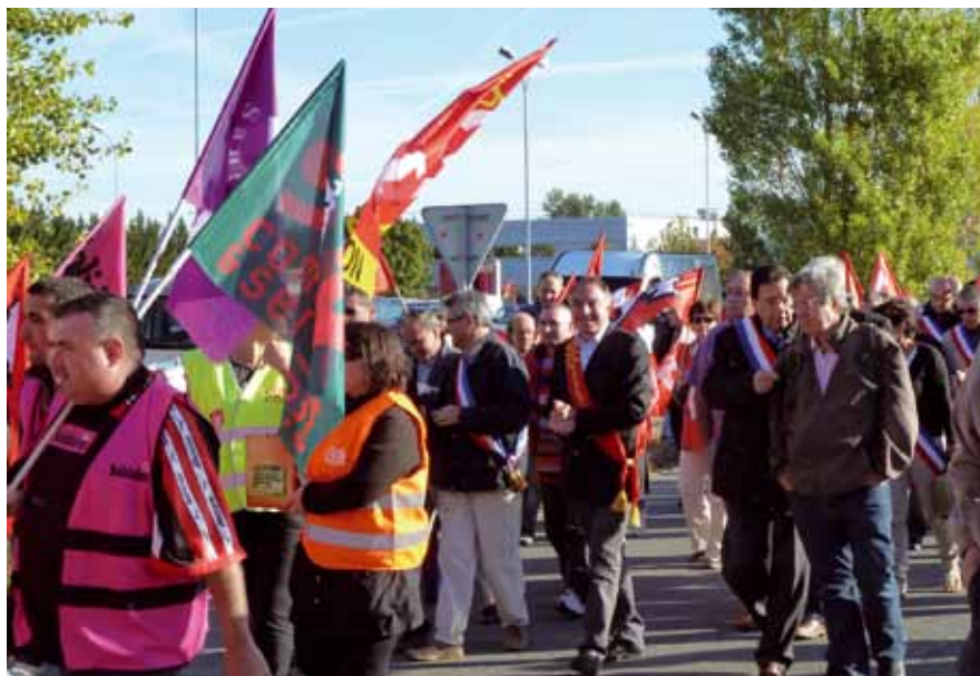
13 juillet, 13 et 20 septembre 2012 : salariés, élus et habitants manifestent devant la base.

Pour rappel : la base Intermarché de Lectoure a ouvert au printemps 1993 avec 160 employés. Dans les années 2000, elle a embauché plus de 300 salariés.