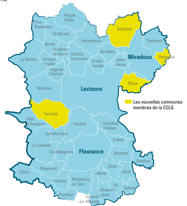
■ Les nouvelles communes membres de la CCLG

Des investissements sont également prévus d'ici la fin de l'année pour améliorer les services et produits proposés pour l'internet haut débit sur les zones blanches et créer une maison de santé pluridisciplinaire (lire page suivante).